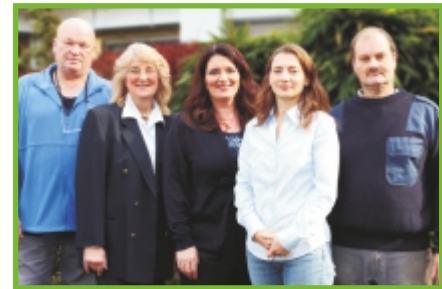
Wir schaffen Ihnen Freiräume

Gerne präsentieren wir Ihnen Ihr neues Büro bei einer unverbindlichen Besichtigung.