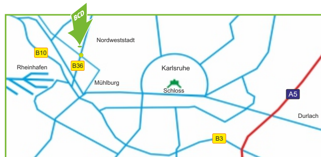
Daimlerstrasse 7-13, 76185 Karlsruhe

Einkaufs- und Verpflegungsmöglichkeiten befinden sich in ca. 200 Meter Entfernung.